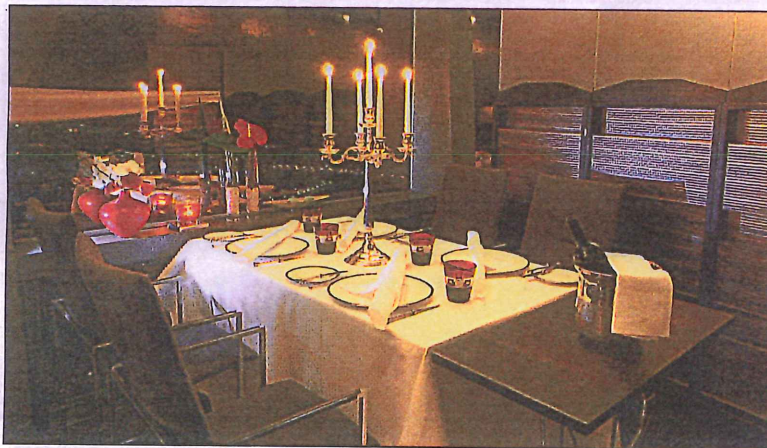
Im Restaurant 181 erleben die Gäste kulinarische Hochgenüsse in exklusivem Ambiente mit einmaligen Ausblick auf die bayerische Hauptstadt.