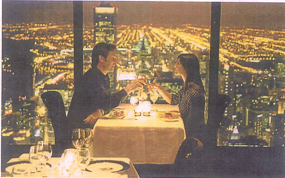
Das Restaurant Signature Room 95th in Chicago. Hier gibt das Olympiaturm-Restaurant ein spektakuläres Gastspiel